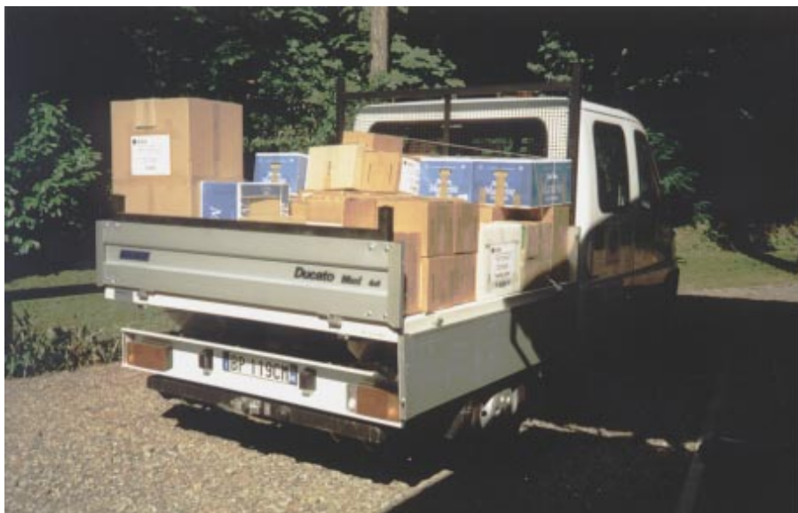
Il camioncino della protezione civile sezionale caricato con gli scatoloni contenenti i viveri ed i materiali raccolti tra gli alpini e gli amici del gruppo di Limbiate è pronto per la partenza.