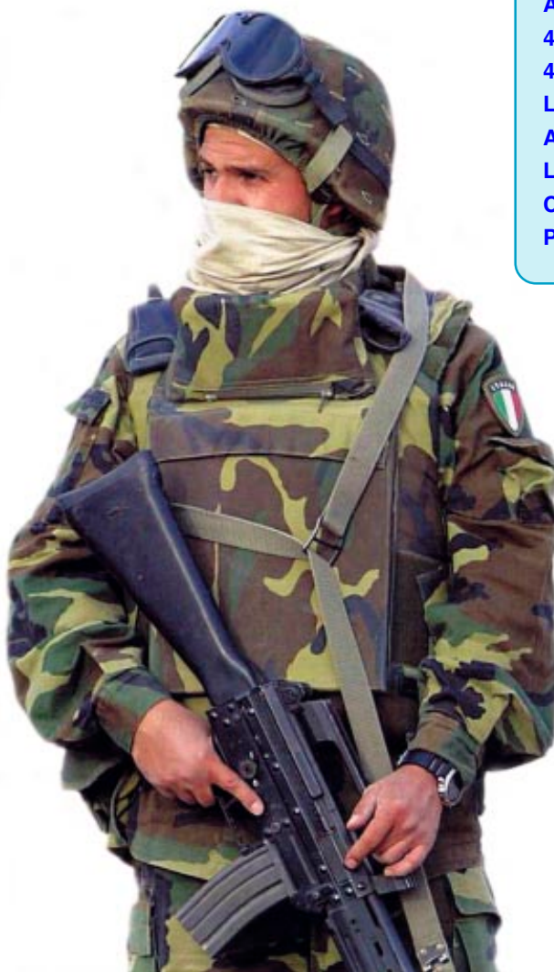
Iraq - Nassirya - L'emblematica immagine di un nostro soldato della missione "Antica Babilonia".

de! Motivi tecnici, che non sto qui ad elencare, hanno impedito la sua consueta uscita per tempo, prima delle Festività Natalizie. Ciò comunque non c'impedisce di porgere ugualmente, seppur tardivi, i migliori auguri di buone feste a tutti voi ed alle vostre famiglie. La tradizionale iconografia natalizia, quest'anno è stata sostituita dalla significativa immagine di un nostro soldato, colta subito dopo l'attentato al nostro contingente dislocato in Iraq, a Nassirya. Questo attentato, oltre alla perdita di tante vite umane, impegnate in una missione che per noi era di pace, penso debba farci riflettere profondamente sulla diversità tra la nostra cultura occidentale, di radici cristiane e quella araba di radici islamiche. Siamo di fronte allo scontro tra una cultura, tollerante come la nostra (arrendevole per quanto riguarda l'Italia), che alla radice ha la dottrina del perdono ed una che si basa sul dettato