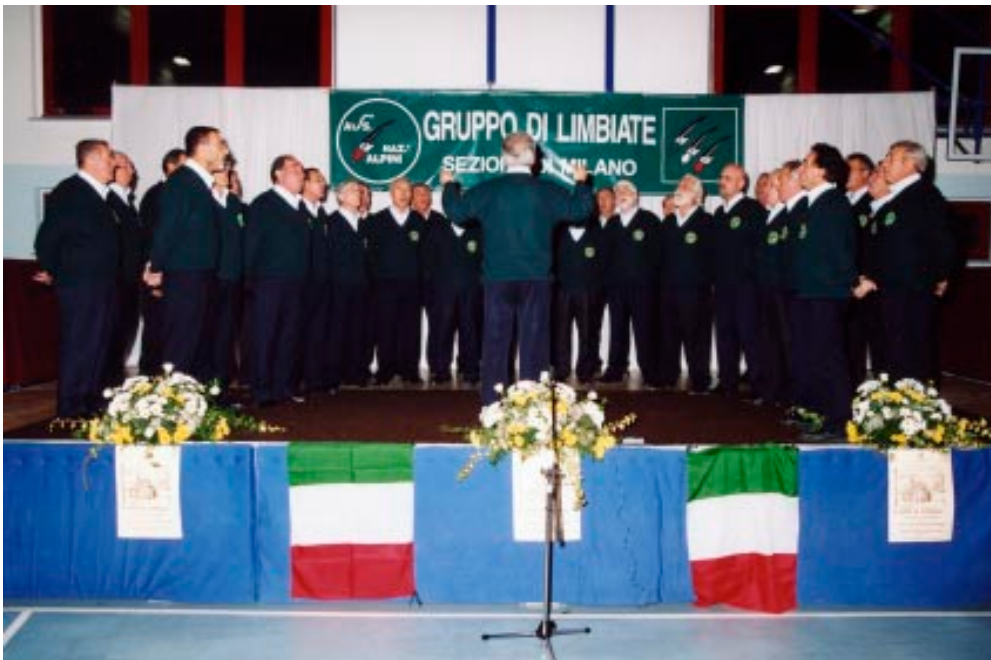
Limbiate 18 ottobre 2003 - "2 a Rassegna Corale Città di Limbiate" - L'esibizione del coro ANA Limbiate.

buon livello qualitativo e di sicuro valore musicale (non intendo giudicare il nostro perché parte direttamente interessata). Tanti sono stati gli applausi distribuiti dal numeroso pubblico presente, che ha così manifestato il proprio gradimento per la bella riuscita della manifestazione; merito, questo, che va dato agli organizzatori della rassegna. E' seguito poi un rinfresco per tutti i coristi ed i loro accompagnatori. Voglio esprimere il mio grazie al cuoco che, coadiuvato da alcuni