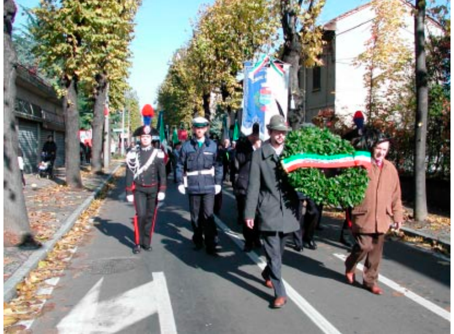
2 novembre 2003 - 85° anniversario della vittoria nella guerra 1915-18. Il corteo per le vie di Limbiate.

to dell'iniziativa, presso l'aula magna delle scuole vi è stato l'incontro con gli alunni ed il corpo in-