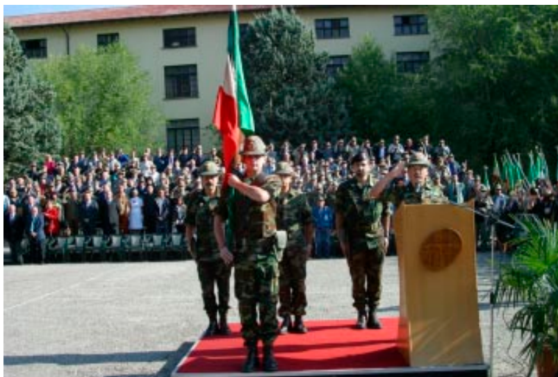
Merano 30 settembre 2004 - cerimonia di chiusura del R.A.R. Edolo

tica nel senso più nobile del termine, battendosi in prima persona e con lui l'intera associazione a difesa di valori, ritenuti superati dai nostri politici. La sospensione "pardon", l'abolizione di fatto della norma costituzionale (vedi art. 52) sul servizio di leva, produrrà entro pochi anni effetti negativi sulle giovani generazioni. Noi siamo tra coloro che, come ha detto qualche ministro, hanno pagato la tassa della leva: "Stia tranquillo signor ministro, sono ben altre le tasse inique in questo nostro Paese, noi siamo orgogliosi e fieri di avere fatto il nostro dovere". La scuola di vita che è stata la naia negli alpini non ha prezzo, abbiamo