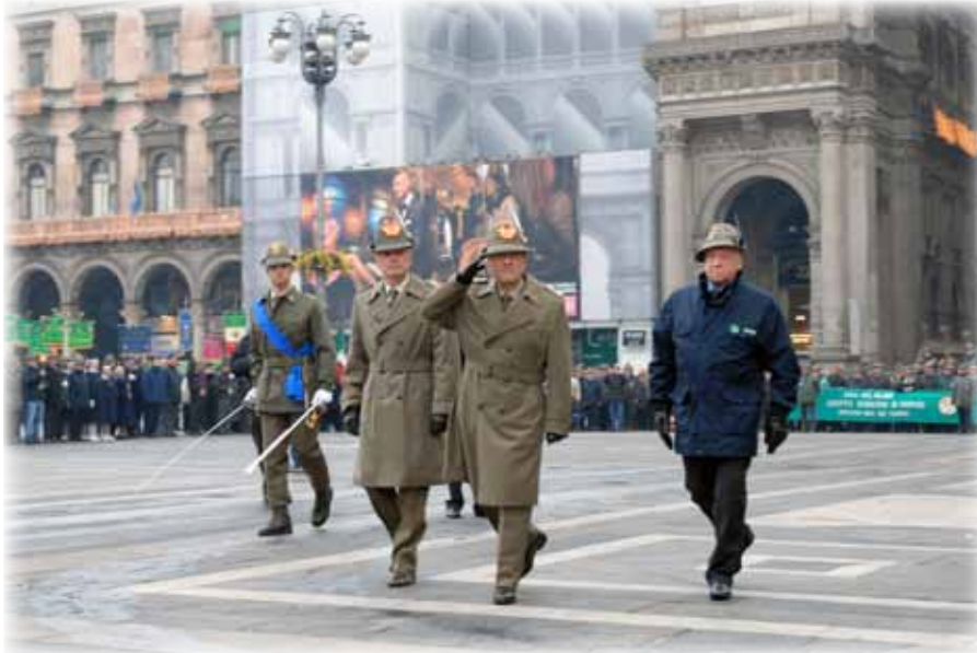
Il generale di C.A. Alberto Primicerj passa in rassegna i gagliardetti dei gruppi

Diversi appuntamenti ci attendono in questi periodi, appuntamenti che vanno dall'inaugurazione del nuovo gruppo di Brugherio, alla riconsegna del gagliardetto al ri-