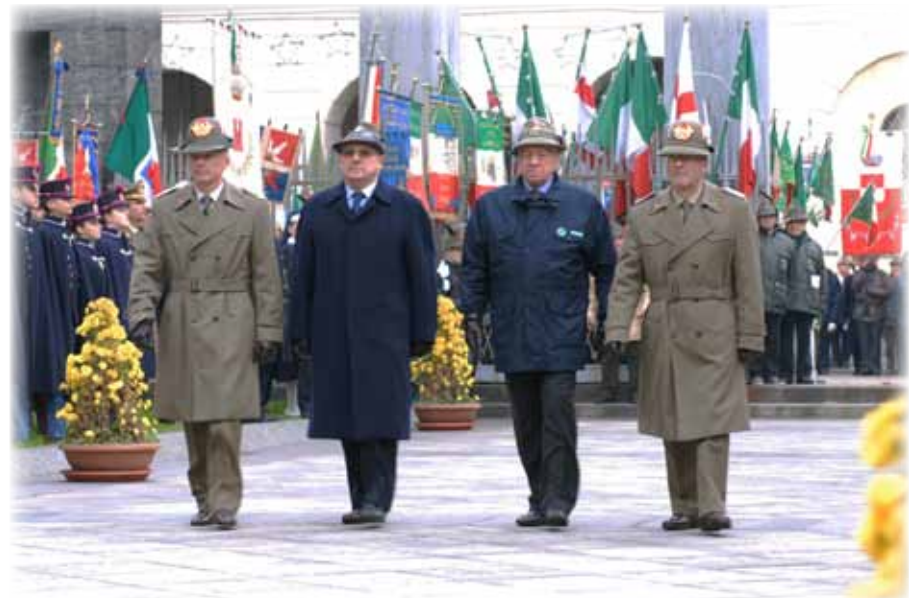
Si rendono gli onori ai caduti al sacrario di Piazza S. Ambrogio

L'avevo già scritto sul numero di dicembre e mi sembra proprio il caso di ribadirlo: l'esempio deve cadere dall'alto, basta privilegi