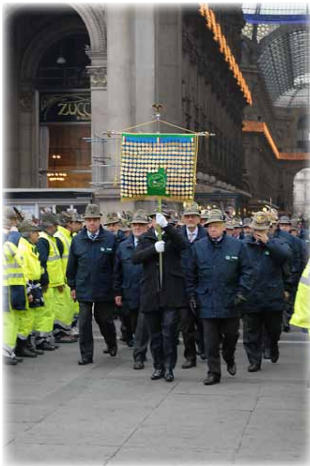
Il labaro dell'ANA fa il suo ingresso in piazza del Duomo

Notiziario, pubblichiamo integralmente il verbale dei lavori.