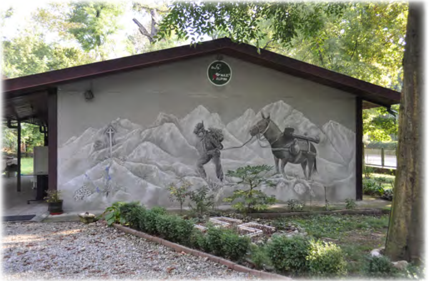
Il dipinto murale realizzato da Greta Gallia sulla parete sud della sede

Realizzato sulla parete sud della sede, lato ingresso, uno splendido dipinto murale raffigurante un Alpino e il suo mulo