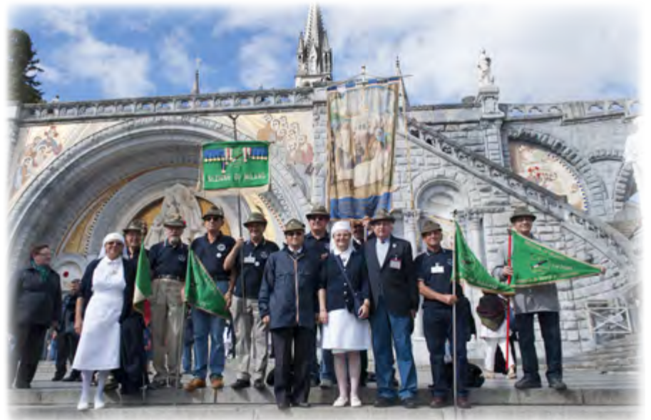
Vessillo sezionale e gagliardetti nella foto di gruppo davanti alla basilica di Lourdes

Non eravamo in molti alpini, ma questo ci ha permesso di costituire un gruppetto affiatato che ha partecipato a tutte le cerimonie, culminate lunedì sera, sotto una leggera ma insistente