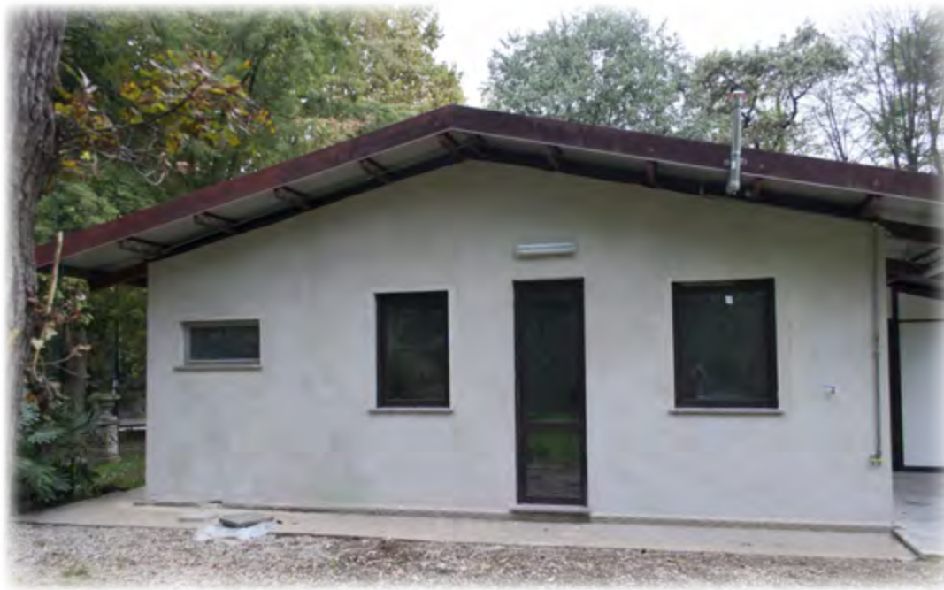
L'ampliamento della sede del Gruppo Alpini di Limbiate, c'è ancora molto da fare, ma già si vede come sarà

per agevolare il lavoro di quanti, alpini e amici, dedicano gratuitamente e appassionatamente il loro tempo libero